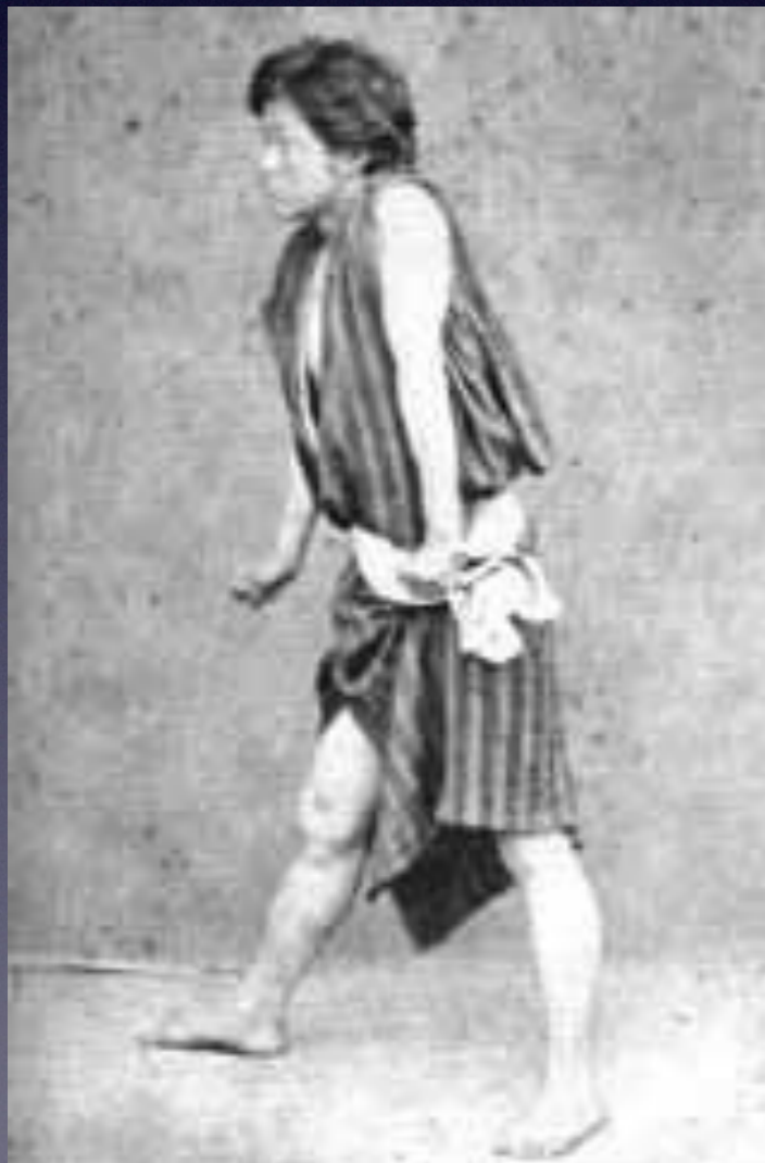
Jigoro Kano, fondateur du Judo Kodokan à 17 ans